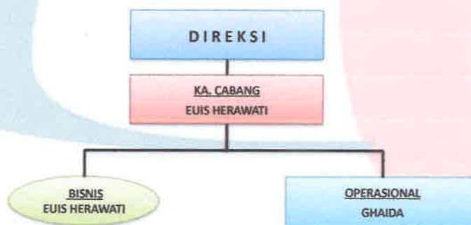
Struktur Organisasi Kantor Cabang